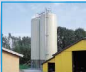
2 stk. 143 m 3 siloer til opbevaring af i alt 2.000 tdr. korn. Silofarve: RAL 5007 (lys grøn).

Gastæt kornsilo type KG er en helstøbt løsning til dig, din økonomi og dine dyr. Siloen er udviklet med henblik på den mest effektive, gastætte kornopbevaring - ingen tørringsomkostninger, bedre trivsel i stalden, højere foderværdi og optimal økonomi i produktionen.