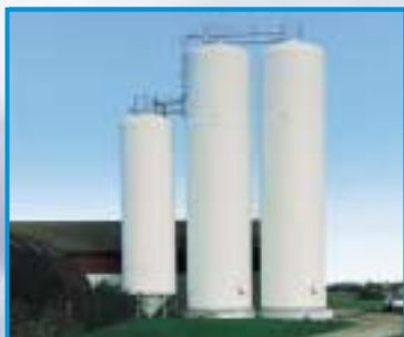
1 stk. 100 m 3 + 2 stk. 210 m 3 siloer til opbevaring af i alt 3.700 tdr. korn. De store siloer står på cirkelfundament.