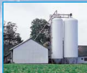
1 stk. 100 m 3 + 1 stk. 143 m 3 siloer til opbevaring af i alt 1.700 tdr. korn. Lejder og gangbro er standard.