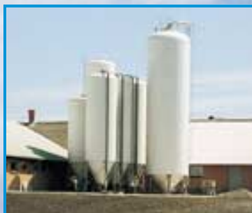
Kombination af gastætte siloer og fodersiloer kan opfylde ethvert behov. Silofarve: RAL 9002 (hvid).